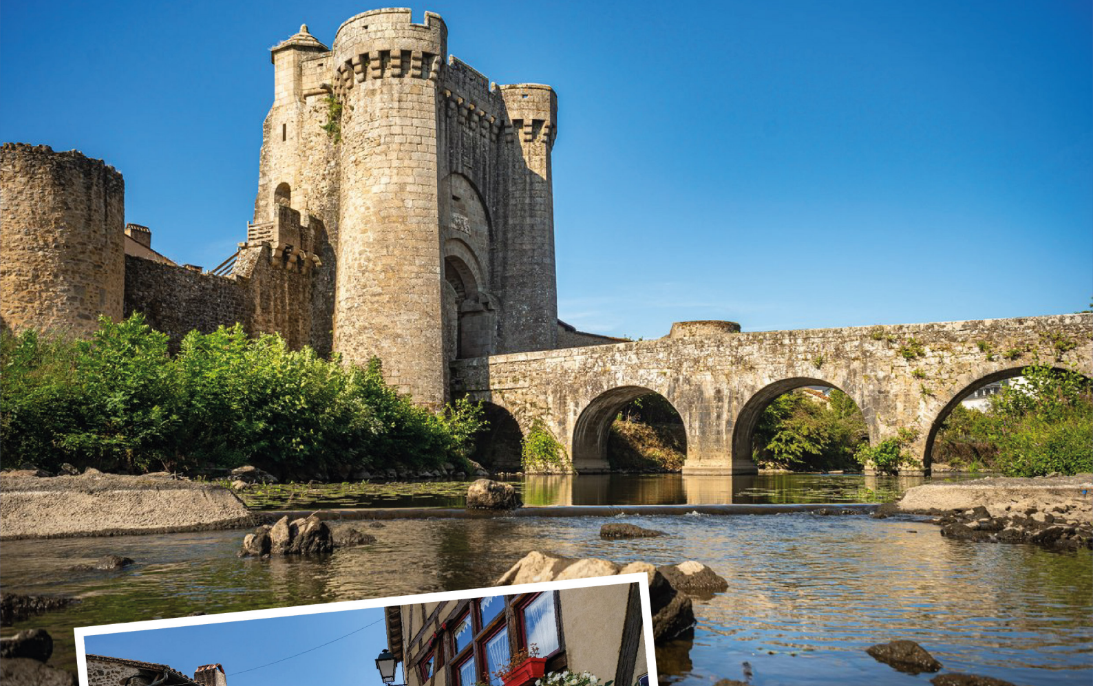
Rue de la Vau Saint-Jacques et sa porte